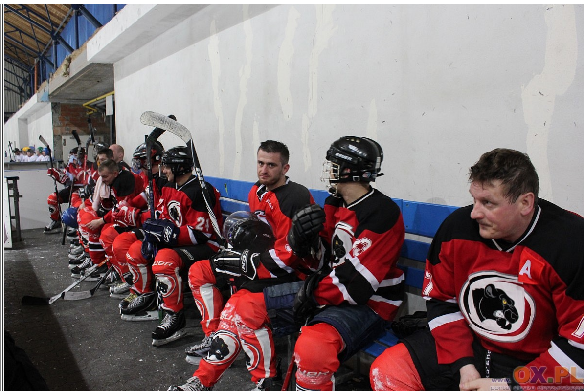
Hokej: HC Czarne Pantery - HC Torpedo Havirov 4:3 Zobacz fotoreportaż>>>>