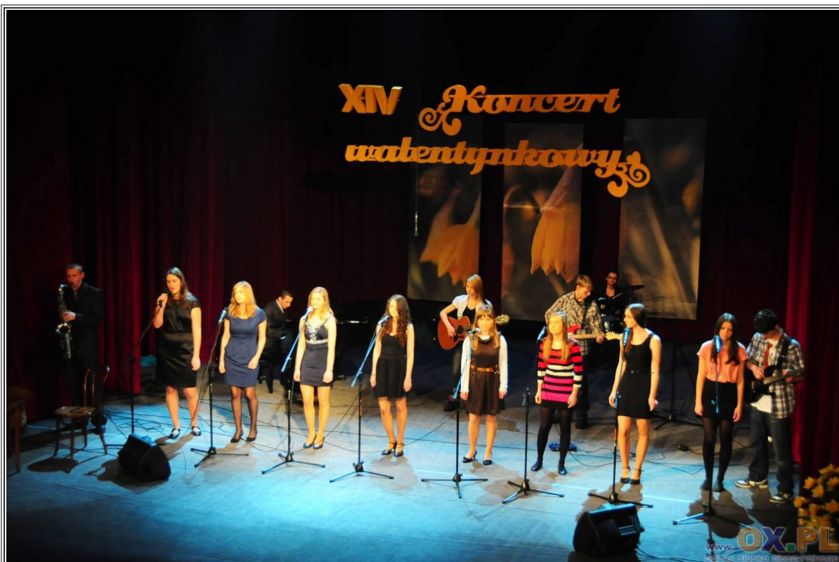
XIV Koncert Walentynkowy na rzecz Cieszyńskiego Hospicjum im. Łukasza Ewangelisty "Pola Nadziei" zorganizowany przez II Liceum Ogólnokształcące im. Mikołaja Kopernika w Cieszynie Zobacz fotoreportaż>>>>