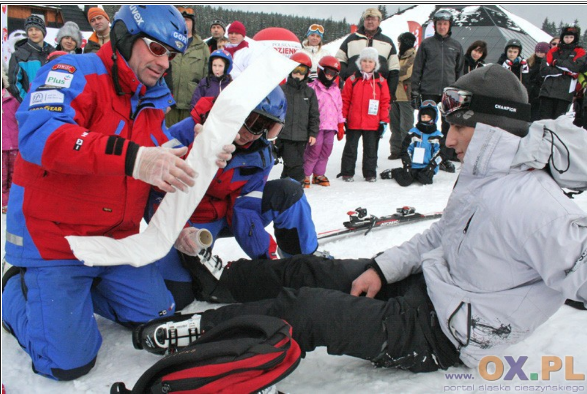
Zimowy Puchar Beskidzkiej 5 i Radia Zet Zobacz cały fotoreportaż>>>