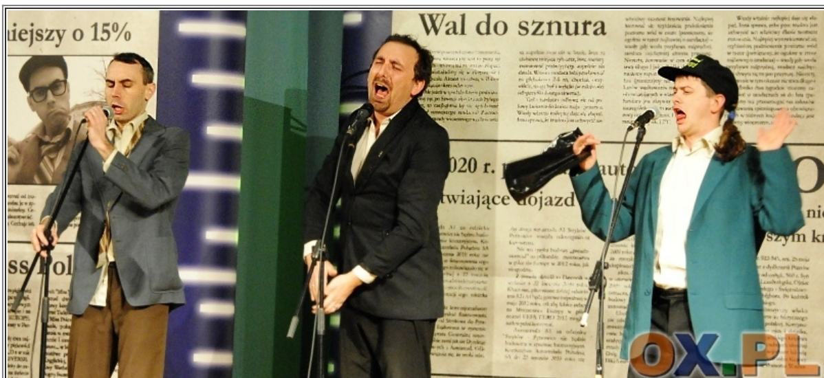
Kabaret Neo-nówka w Ustroniu. Zobacz cały fotoreprotaż>>>

Redakcja zastrzega sobie prawo do niepublikowania nadesłanych zdjęć bez podania przyczyny