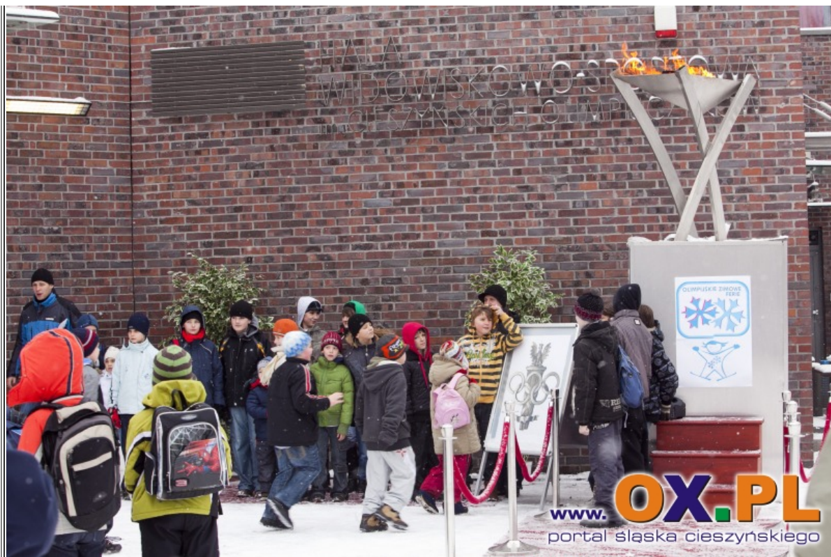
W poniedziałek 24 stycznia 2011 przy cieszyńskim lodowisku odbyło się uroczyste otwarcie Olimpijskich Zimowych Ferii. Zobacz cały Fotoreportaż>>>