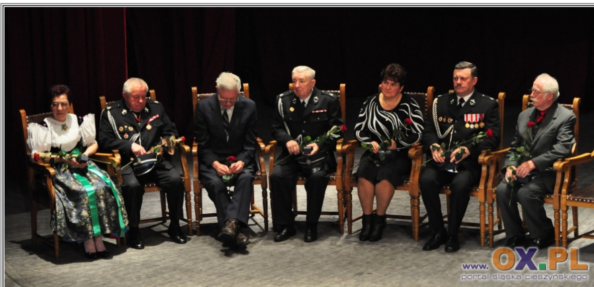
Uroczysta Sesja Samorządów Ziemi Cieszyńskiej w dniu 11 Listopada połączona z wręczaniem Laurów Ziemi Cieszyńskiej Zobacz fotoreportaż>>>>

Zrobiłeś/aś ciekawe zdjęcie? Sfotografowałeś lokalnego polityka? sfotografowałeś ciekawe zdarzenie? uważasz, że twoje zdjęcie powinno się tutaj znaleźć w najbliższą niedzielę? Prześlij je na adres redakcja@ox.pl z dopiskiem "tydzień w obiektywie". Za opublikowane zdjęcie otrzymasz dodatkowe punkty w naszym klubie ox.pl .