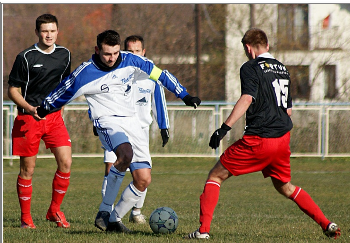
LKS Wisła Strumiień - KP Beskid 09 Skoczów - 1:1 Zobacz fotoreportaż>>>>