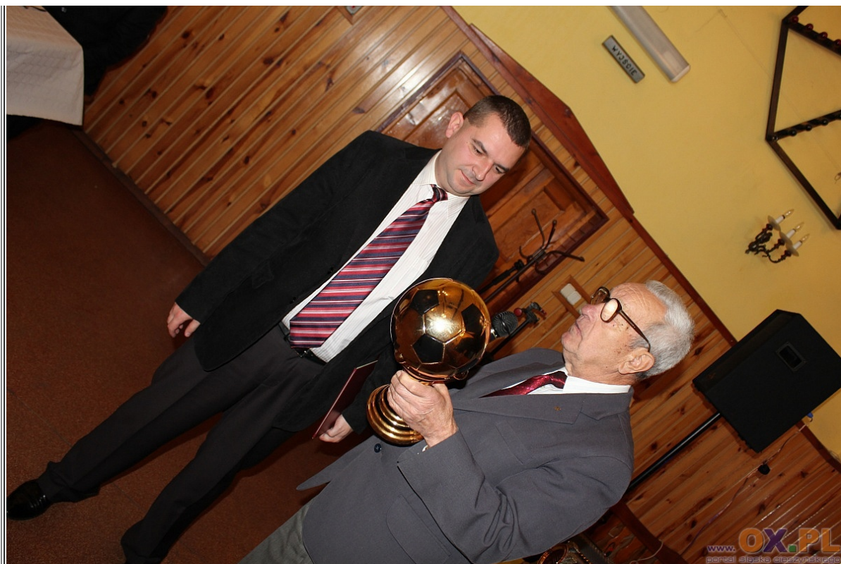
Uroczystość wręczenia odznaczeń Beskidzkiego Okręgu Związku Piłki Nożnej z okazji 65-lecia klubu GKS Morcinek Kaczyce Zobacz fotoreportaż>>>>