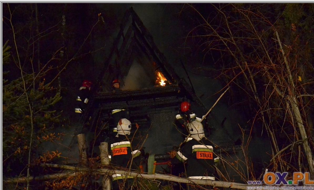
Pożar domku letniskowego w Brennej (06.11.2011) Zobacz fotoreportaż>>>>