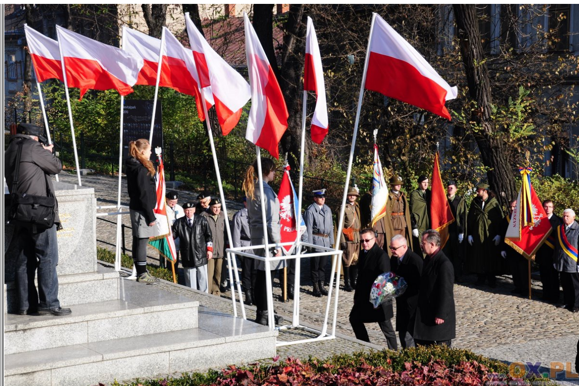
Cieszyn: Uroczystości Patriotyczne obchodów Święta Niepodległości Zobacz fotoreportaż>>>>