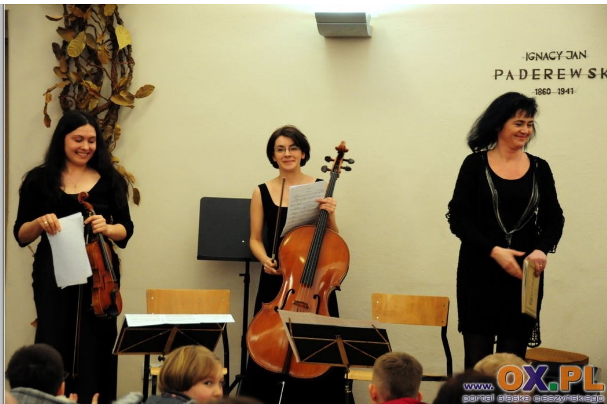
Koncert nauczycieli w Państwowej Szkole Muzycznej im. I.J.Paderewskiego w Cieszynie Zobacz cały fotoreportaż>>>