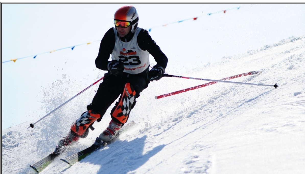
Puchar Złotego Gronia Zobacz cały fotoreportaż>>>