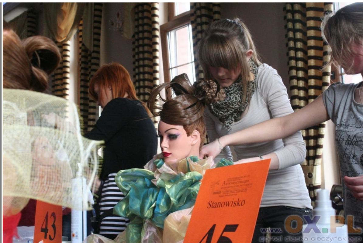
Konkurs młodych fryzjerów w Skoczowie Zobacz cały fotoreportaż>>>