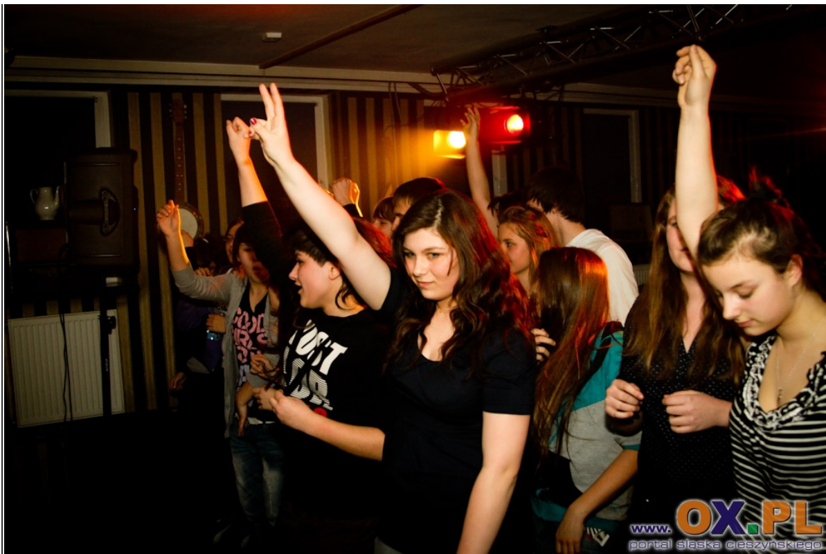
Koncert Silesian Sound w Chybiu Zobacz cały fotoreportaż>>>