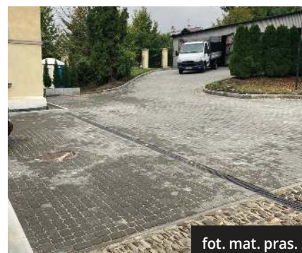
fot. mat. pras.

■ W roku 2023 – przebudowę istniejącej nawierzchni dziedzińca wraz ze schodami budynku Cmentarza Komunalnego przy ul. Katowickiej 34 w Cieszynie – 484 620,00 zł + nadzór inwestorski 4 000,00 zł.