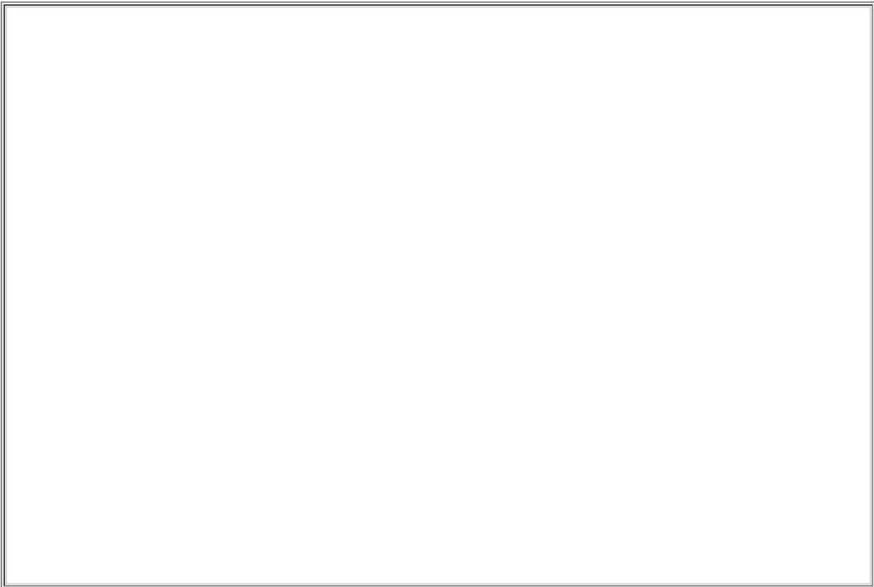
Choinka na rynku w Strumieniu.