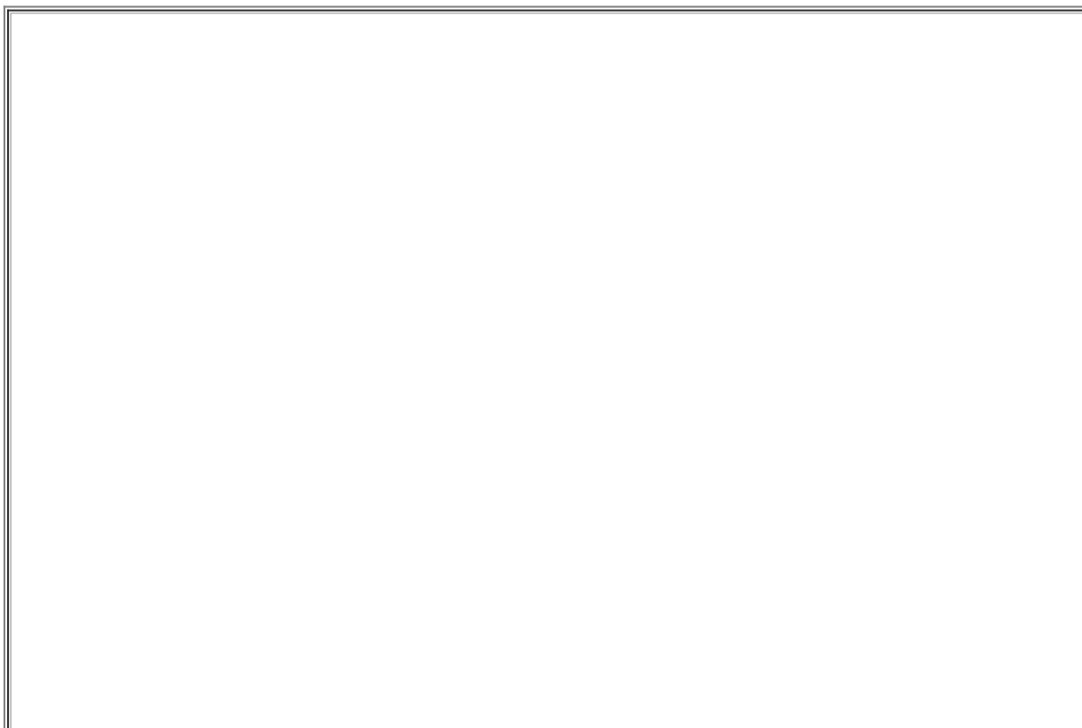
Choinka na rynku w Cieszynie.

Poniżej prezentujemy zdjęcia, a Wy głosujcie w naszej sondzie - PRZEJDŹ>>>