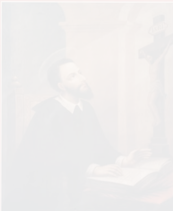
ŚW. JAN SARKANDER PATRON DIECEZJI BIELSKO-ŻYWIECKIEJ

➔ W epoce zjednoczenia Europy wzorcowymi postaciami, które w oparciu o reprezentowane przez siebie wartości duchowe dodatkowo owo zjednoczenie wzmacniają, są jednostki, które zostały wyniesione na ołtarze. Stają się one bowiem wzorem niezłomnego trwania przy wyznawanych zasadach, niezależnie od otaczającej rzeczywistości. Przypadająca na 21 maja 25. rocznica kanonizacji św. Jana Sarkandra (1576–1620) daje asumpt do krótkiego przypo... See more